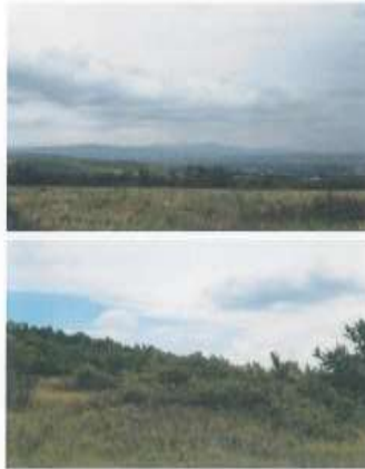
Fig.2. Fotografitë e terrenit

Zyrtare e operacioneve për administrim të aseteve: M. Ceman Morina