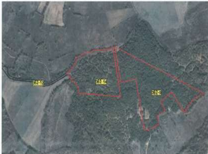
Fig.1 Ortofoto, parcelat kadastrale 362-9 & 362-14

Toka është e regjistruar në certifikatën e pronësisë me numër të njësisë P-71006004-362-9 me sipërfaqe prej 25800 m 2 me kulturë Mal i klasës 3, P-71006004-362-14 me sipërfaqe prej 18080m 3 me kulturë Mal i klasës 3, sipërfaqja e përgjithshme e tyre është 43880 m 2 Z.K Berkovë.