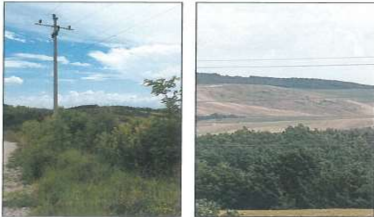
Pamje e parcelës nr.56-30 dhe pamje nga largësia e parcelës nr.56-41 z.k Dranashiq

Fotografia e mëposhtme e realizuar nga largësia prezanton gjendjen e parcelave në z.k Dranashiq: