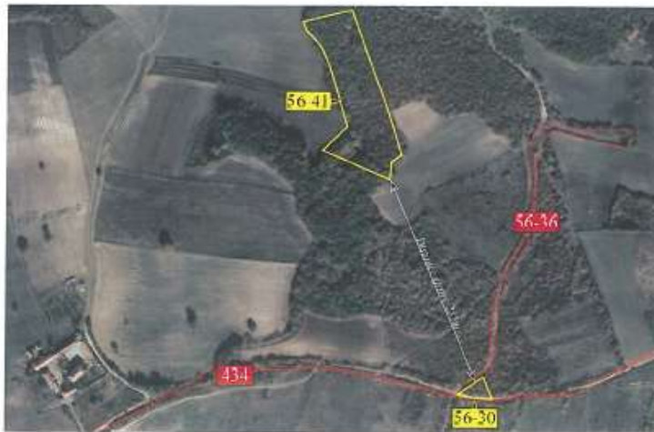
Ortofoto e parcelave nr.56-30 dhe 56-41 z.k Dranashiq, Klinë.

Parcela nr. 56-41 ka sipërfaqe prej 8608 m 2 me kulturë pyjor , mal i klasës 3.