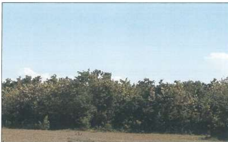
Pamje nga larg e parcelës nr.261-5 z.k Dubravë, Istog

Fotografia e mëposhtme prezanton gjendjen faktike të parcelës nr.261-5 z.k Dubravë: