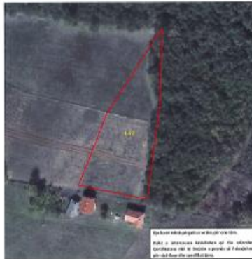
Fig.1 Ortofoto, parcela kadastrale 1-92 në ZK Jabllanicë

Toka është e regjistruar në certifikatën e pronësisë, parcela kadastrale me nr të njësisë P-71611039-0001-92 me sipërfaqe 2652m 2 me kulturë Kullosë e klasës 2 në vendin e quajtur "Jelinjak".