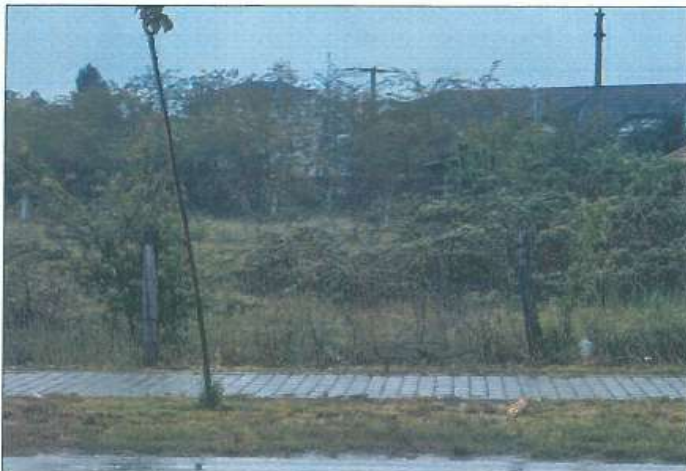
Pamje e parcelës nr.939-4 dhe 939-5 z.k Skivjan, Komuna e Gjakovës

Fotografia e mëposhtme prezanton gjendjen e parcelës nr. 939-4 dhe 939-5 z.k Skivjan, Komuna e Gjakovës: