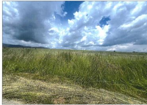
Fig. 1 Fotografia e terrenit për parcelën 631-0 ZK Sushicë

Zyrtare Kadastrale: Blerta Jashari Kastrati