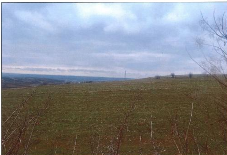
Pamje e parcelës nr.148-3 z.k Klinavc, Klinë

Fotografia e mëposhtme prezanton gjendjen faktike në terren :