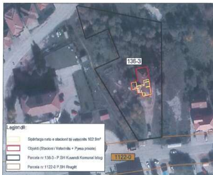
Ortofoto, Stacioni i Veterinës në z.k Gjurakoc, Komuna e Istogut

Me datë 10.07.2023 zyrtarët e AKP-së vizituan Stacionin e Veterinës në z.k Gjurakoc, Komuna e Istogut.