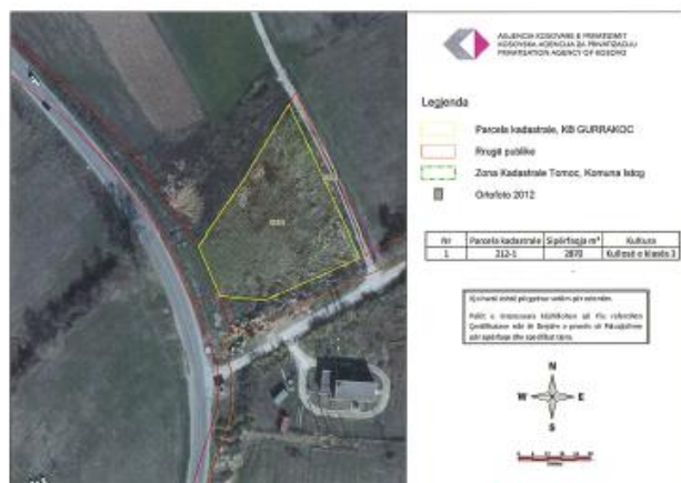
Fig. 1. Ortofoto, parcela kadastrale 212-1 ZK Tomoc

Toka është e regjistruar në certifikatën e pronësisë, parcela kadastrale me nr të njësisë P70806051-00212-1 me sipërfaqe 2870m 2 me kulturë Kullosë e klasës 3 1/1, në vendin e quajtur "Begu".