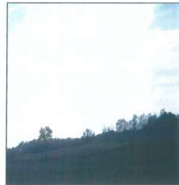
Ortofoto, fotografi e terrenit parcelat kadastrale 244-1, 245-4

Nga gjendja faktike në teren konstatuam se: