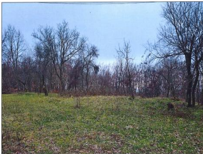
Pamje e parcelës nr.679-0 z.k Orobërdë, Komuna e Istogut

Fotografia e mëposhtme prezanton gjendjen e parcelës nr. 679-0 z.k Orobërdë, Komuna e Istogut: