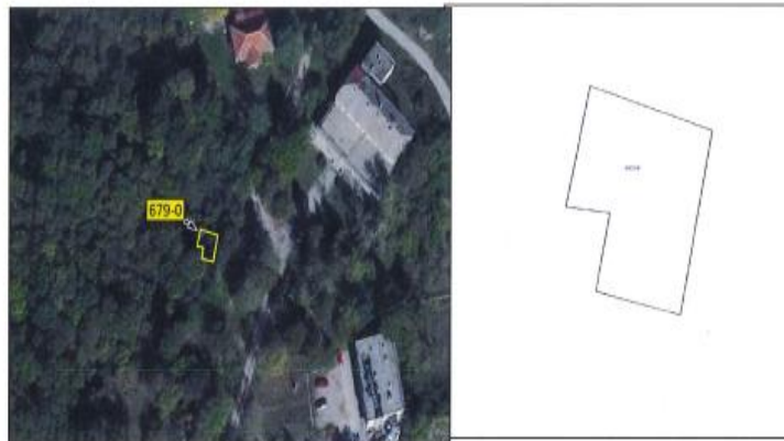
Ortofoto dhe kopja e planit për parcelën nr.679-0 z.k Orobërdë, Komuna e Istogut

Parcela sipas certifikatës së pronësisë evidentohet në emër të KB Dubrava, me sipërfaqe prej 40m 2 dhe me kulturë : tokë ndërtimore/shtëpi ndërtesë .