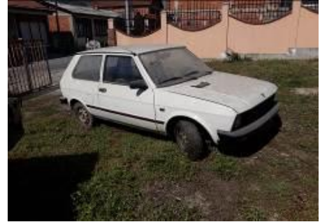
Yugo 2 (godina proizvodnje 1998)