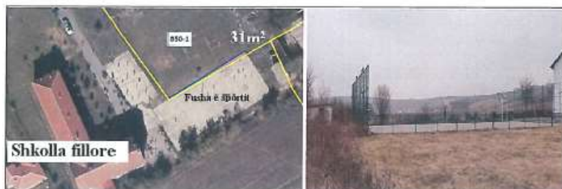
Pamje e pjesës jug-perëndimore e parcelës nr.850-1