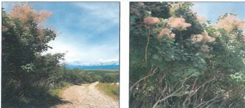
Fotografie e parcelës nr.433-28 z.k Dranashiq, Klinë

Fotografitë e mëposhtme prezantojnë gjendjen e parcelës në z.k Dranashiq: