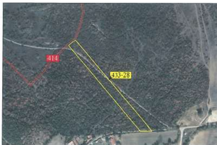
Ortofoto për parcelën nr. 433-28 z.k Dranashiq, Klinë.

Parcela sipas certifikatës së pronësisë evidentohet në emër të NPB Malishgan. Sipërfaqja e përgjithshme e parcelës nr.433-28 është 5401 m 2 (54 ari dhe 1m 2 ), me kulturë: pyjor-mal i klasës 3.