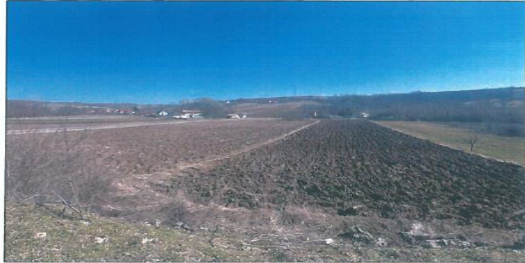
Pamje e parcelës nr.199-3 z.k Dranashiq, Klinë.

Fotografia e mëposhtme prezanton gjendjen e parcelës nr.199-3 z.k Dranashiq, Klinë: