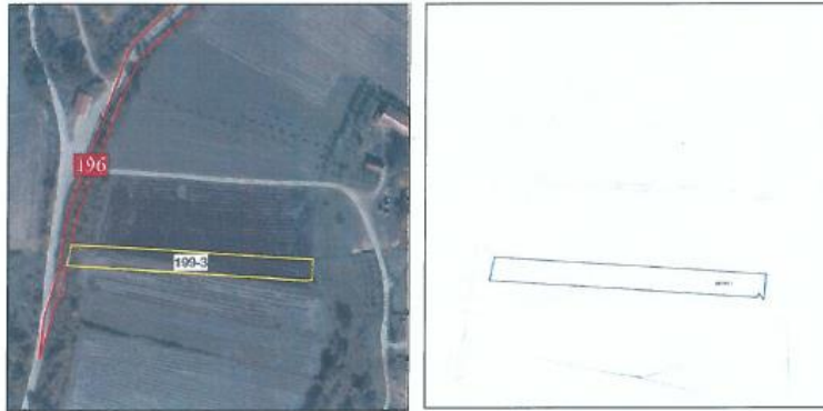
Ortofoto dhe kopja e planit për parcelën nr.199-3 z.k Dranashiq, Komuna e Klinës

Parcela sipas certifikatës së pronësisë evidentohet në emër të NPB Malishgan, me sipërfaqe prej 1566m 2 (15 ari dhe 66 m 2 ) me kulturë : bujqësore, arë e klasës 4.