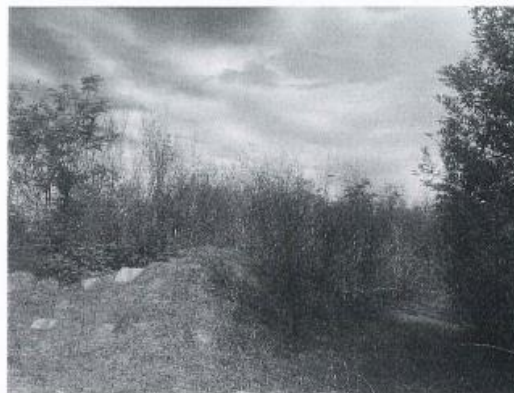
Fig. 2 Fotografi nga terreni

AGJENCIA KOSOVARE E PRIVATIZIMIT KOSOVSKA AGENCIJA ZA PRIVATIZACIJU PRIVATISATION AGENCY OF KOSOVO