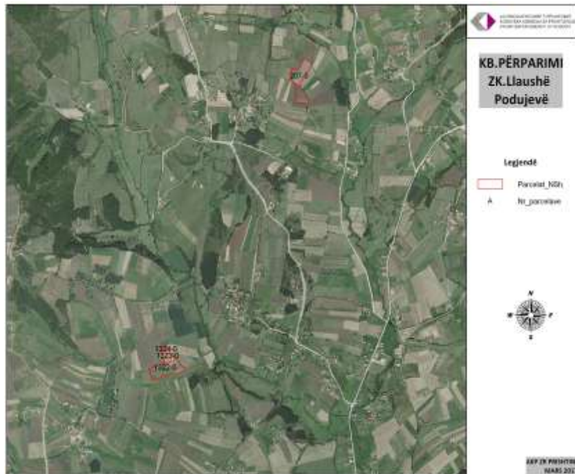
KB Përparimi Tokë Bujqësore Llaushë – orientimi nga gjeoportali

Foto/fotot Ose informata të tjera Për asetet në shitje