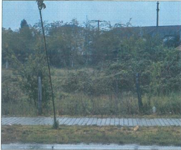
Pamje e parcelës nr.939-4 dhe 939-5 z.k Skivjan, Komuna e Gjakovës

Fotografia e mëposhtme prezanton gjendjen e parcelës nr. 939-4 dhe 939-5 z.k Skivjan, Komuna e Gjakovës: