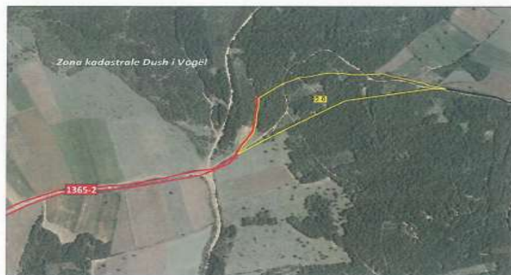
Fig 1.Ortofoto, parcela kadastrale me nr të njësisë 22 0

Toka është e regjistruar në certifikatën e pronësisë, parcela kadastrale me nr të njësisë P-71006045-00022 sipërfaqe prej 23283m 2 me kulturë Mal i klasës 5 në vendin e quajtur "Siqeva e epërme-Mali Dush".