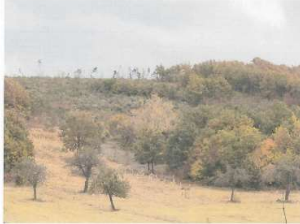
Fig.2 Fotografi e terrenit, parcela kadastrale 22-0

Zyrtare Kadastrale Rajonale: Blerta Jashari Kastrati