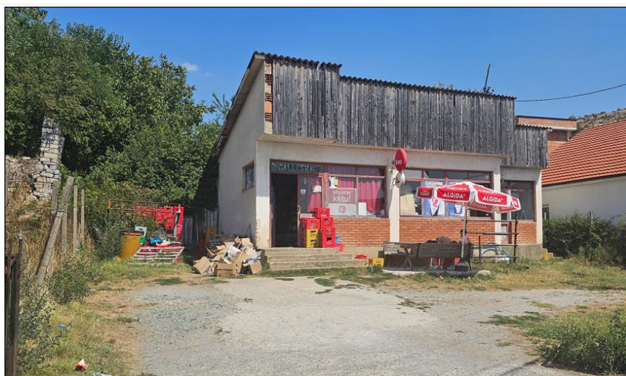
NSH 25 Maji-Lokali ne Kosterc

Fotografija/fotografije ili druge informacije u vezi imovine na prodaji