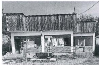
Nuk ka ndryshime nga vizita e fundit me dt.03.09.2024.