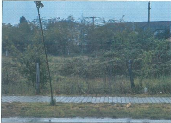
Pamje e parcelës nr.939-4 dhe 939-5 z.k Skivjan, Komuna e Gjakovës

Fotografia e mëposhtme prezanton gjendjen e parcelës nr. 939-4 dhe 939-5 z.k Skivjan, Komuna e Gjakovës: