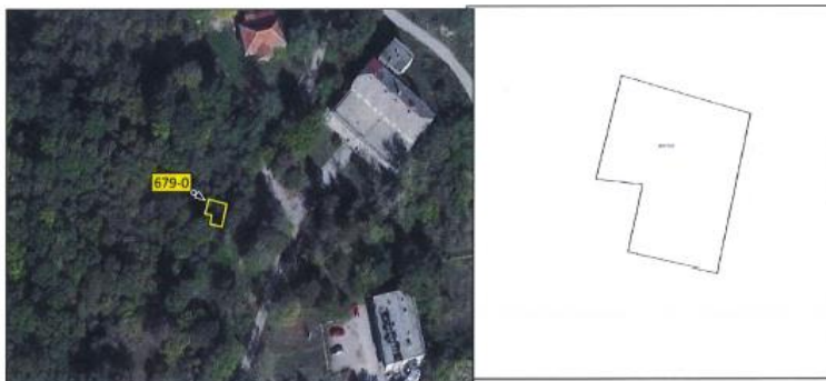
Ortofoto dhe kopja e planit për parcelën nr.679-0 z.k Orobërdë, Komuna e Istogut

Parcela sipas certifikatës së pronësisë evidentohet në emër të KB Dubrava , me sipërfaqe prej 40m 2 dhe me kulturë : tokë ndërtimore/shtëpi ndërtesë .