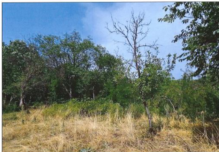
Pamje e parcelës nr.679-0 z.k Orobërdë, Komuna e Istogut

Fotografia e mëposhtme prezanton gjendjen e parcelës nr. 679-0 z.k Orobërdë, Komuna e Istogut: