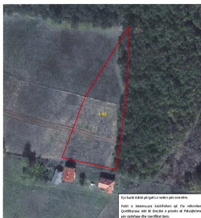
Fig.1 Ortofoto, parcela kadastrale 1-92 në ZK jabllanicë

Toka është e regjistruar në certifikatën e pronësisë, parcela kadastrale me nr të njësisë P-71611039-0001-92 me sipërfaqe 2652m 2 me kulturë Kullosë e klasës 2 në vendin e quajtur "Jelinjak".