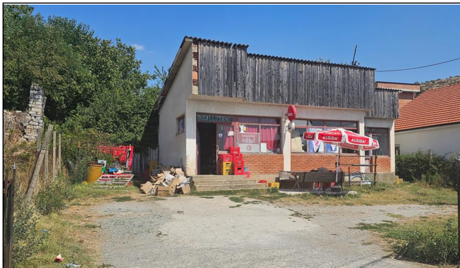
NSH 25 Maji-Lokali ne Kosterc

Foto/fotot Ose informata të tjera Për asetet në shitje