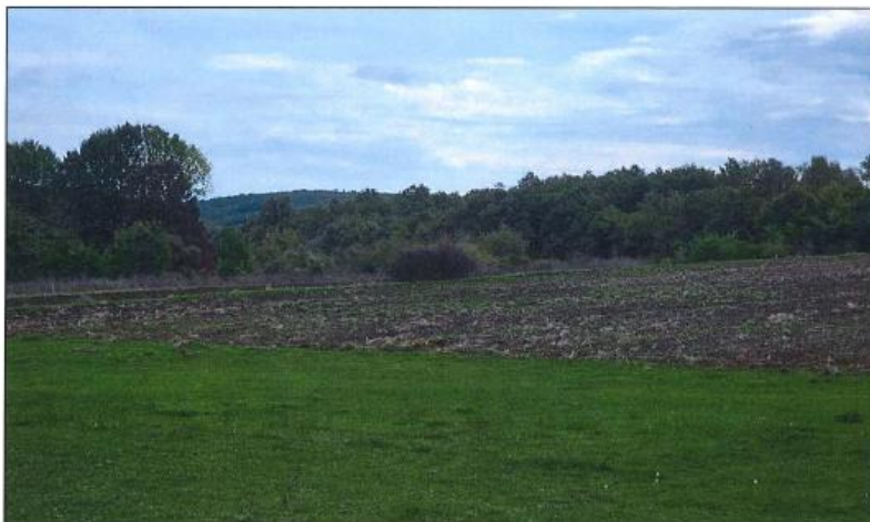
Pamje e parcelës nr.97-2 z.k Gjurgjevik, Klinë

Fotografia e mëposhtme prezanton gjendjen faktike në terren :