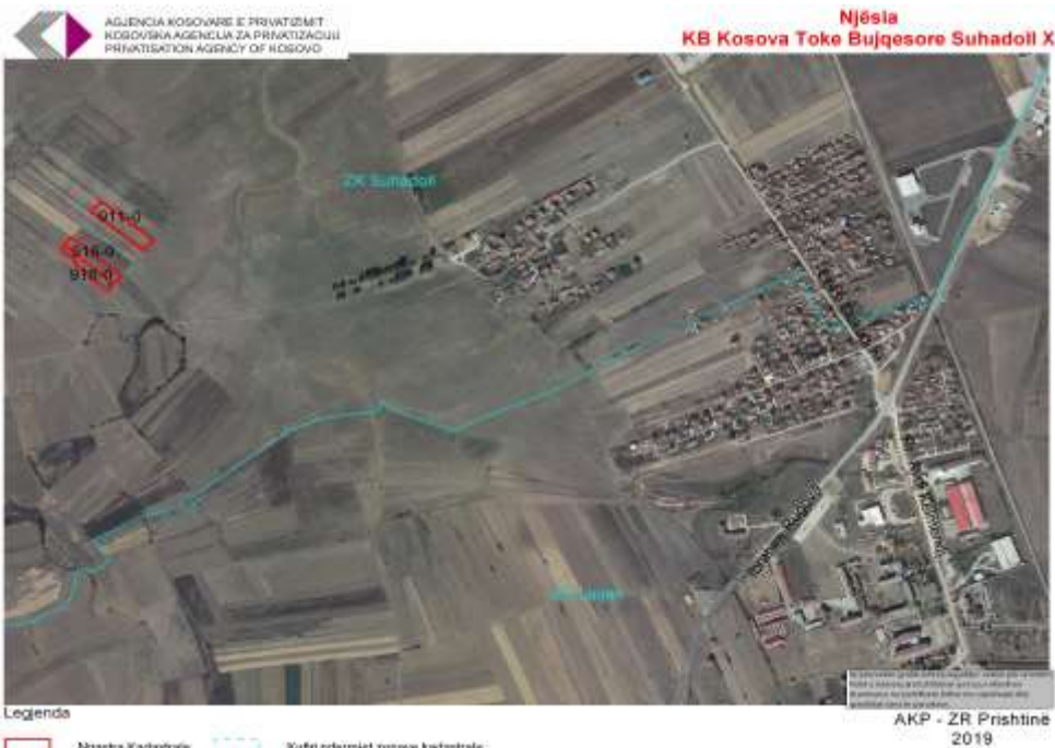
KB Kosova Tokë Bujqësore Suhadoll X – pika orientuese nga gjeoportali

Foto/fotot Ose informata të tjera Për asetet në shitje