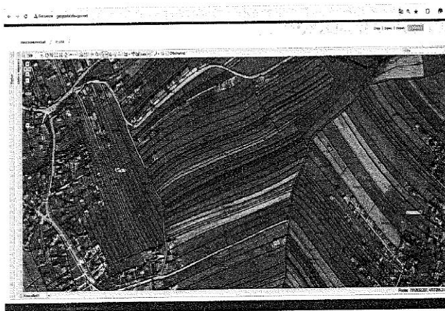
Fig.1 Ortofoto, parcela kadastrale nr.735-0, ZK Gilgoc; http://geoportal.rks-gov.net/

Nga raporti i të dhënave kadastrale (Certifikata nga SIKTK, shërbimet digjitale) prona evidentohet në emër të P.SH. Kooperativa Bujqësore Kosova Lipjan me numër të njësisë P-71409018-00735-0 me sipërfaqe 5689m 2 (56ari e 89m 2 ) me kulture bujqësore Are e klasës 2-të.