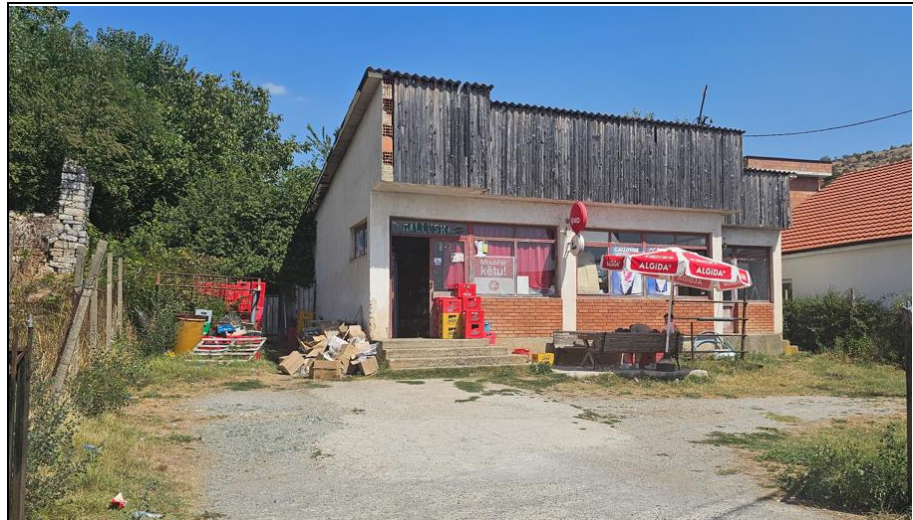
NSH 25 Maji-Lokali ne Kosterc

Fotofarfiija/fotografije ili drugi podaci o imovinu za prodaju