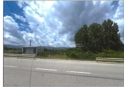
Fig. 1 Fotografitë e terrenit për parcelën 160-1 ZK Rakosh

Zyrtare Kadastrale: Blerta Jashari Kastrati