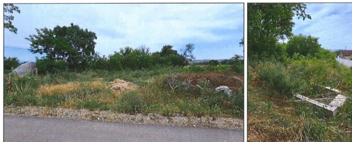
Pamje e parcelës nr.576-2 z.k Videjë, Komuna e Klinës

Fotografitë e mëposhtme prezantojnë gjendjen faktike të parcelës nr. 576-2 z.k Videjë, Klinë: