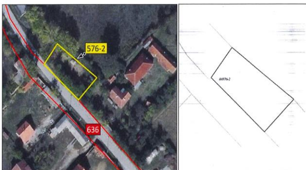
Ortofoto dhe kopja e planit për parcelën nr. 576-2 z.k Videjë, Komuna e Klinës.

Parcela sipas certifikatës së pronësisë evidentohet në emër të KBI Bujqësia, me sipërfaqe prej 497m 2 dhe kulturë bujqëore-kullosë e klasës 1.