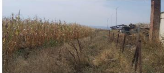
Fig. 2 Fotografi nga tereni

AGJENCIA KOSOVARE E PRIVATIZIMIT KOSOVSKA AGENCIJA ZA PRIVATIZACIJU PRIVATISATION AGENCY OF KOSOVO