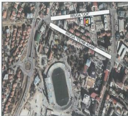
Ortofoto- NSH Apiko, Depo në Prishtinë

Me datë 21.06.2024 zyrtarët e AKP ZR Pejë vizituan pronën e NSH Apiko, Depo në Prishtinë e cila ndodhet në rrugën "UÇK" Qafa 1- Prishtinë.