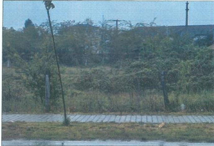
Pamje e parcelës nr.939-4 dhe 939-5 z.k Skivjan, Komuna e Gjakovës

Fotografia e mëposhtme prezanton gjendjen e parcelës nr. 939-4 dhe 939-5 z.k Skivjan, Komuna e Gjakovës: