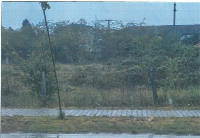
Pamje e parcelës nr.939-4 dhe 939-5 z.k Skivjan, Komuna e Gjakovës

Fotografia e mëposhtme prezanton gjendjen e parcelës nr. 939-4 dhe 939-5 z.k Skivjan, Komuna e Gjakovës: