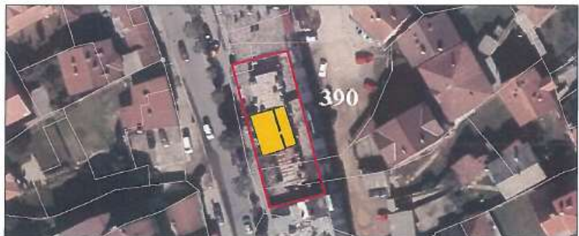
Pamje e dyqanit nr.2 dhe pozicionimi i saj në ortofoto

Informatat rreth Njesisë lëndë e shitjes të prezentuar në Te Dhëna nuk janë të garantuara. Investoret potencial inkurajohen të kontaktojnë Agjencinë Kosovare të Privatizimit (AKP) për të kërkuar dokumentet e tenderit. Ata të cilet dëshirojnë të paraqesin ofertë duhet të llogarisin në hulumtimet e tyre. Investoret potencial këshillohen të bëjnë verifikimin e të dhënave vet para se të paraqesin ndonjë ofertë ose propozim për tender. Këto të Dhëna janë në dispozicion nën kushtet e përgjithshme në informatat paraprake për informacione të publikut të gjerë për kandidatët e privatizimit, e cila mund të nxirret nga faqja e internetit të AKP-së: http://www.pak-ks.org .