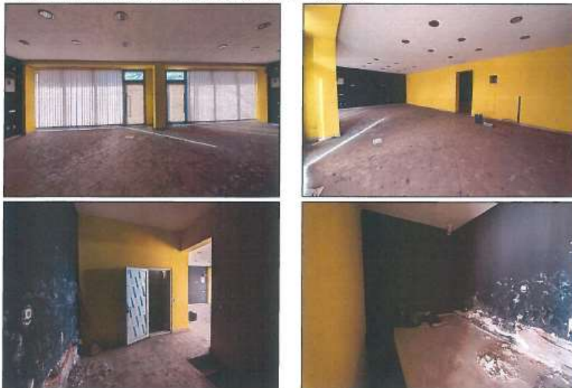
Pamje e katit përdhësë

Fotografitë e mëposhtme prezantojnë gjendjen faktike në terren :