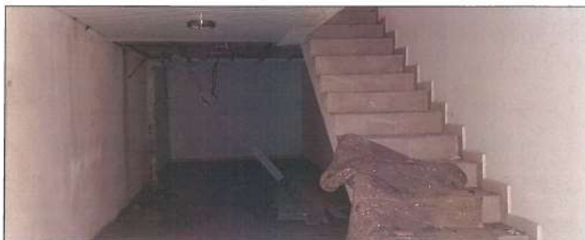
Pamje e bodrumit