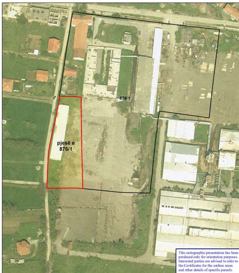
Foto imazh i Ndërmarrjes së Re

REPUBLIKA E KOSOVËS - REPUBLIKA KOSOVO - REPUBLIC OF KOSOVO AGJENCIA KOSOVARE E PRIVATIZIMIT - KOSOVSKA AGENCIJA ZA PRIVATIZACIJU - PRIVATISATION AGENCY OF KOSOVO