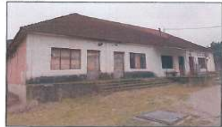
Pamje e objekteve në gjendje relativisht të mirë me sipërfaqe 454m 2