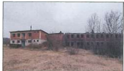
Pamje e objekteve të demoluara (Porta dhe Objekti P+1) me sip. të llogaritura nga ortofototo 1358m 2