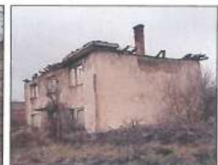
Pamje e objekteve-gërmadha