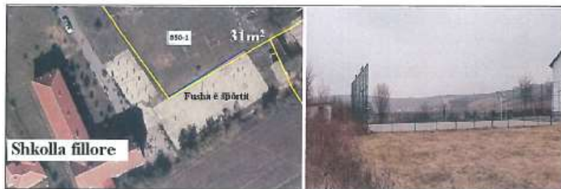
Pamje e pjesës jug-perëndimore e parcelës nr.850-1

Informatat rreth Njesisë lëndë e shitjes të prezentuar në Te Dhena nuk janë të garantuara. Investoret potencial inkurajohen të kontaktojnë Agjencinë Kosovare të Privatizimit (AKP) për të kërkuar dokumentet e tenderit. Ata të cilet dëshirojnë të paraqesin ofertë duhet të llogarisin në hulumtimet e tyre. Investoret potencial këshillohen të bëjnë verifikimin e të dhënave vet para se të paraqesin ndonjë ofertë ose propozim për tender. Këto të Dhëna janë në dispozicion nën kushtet e përgjithshme në informatat paraprake për informacione të publikut të gjerë për kandidatët e privatizimit, e cila mund të nxirret nga faqja e internetit të AKP-së: http://www.pak-ks.org .