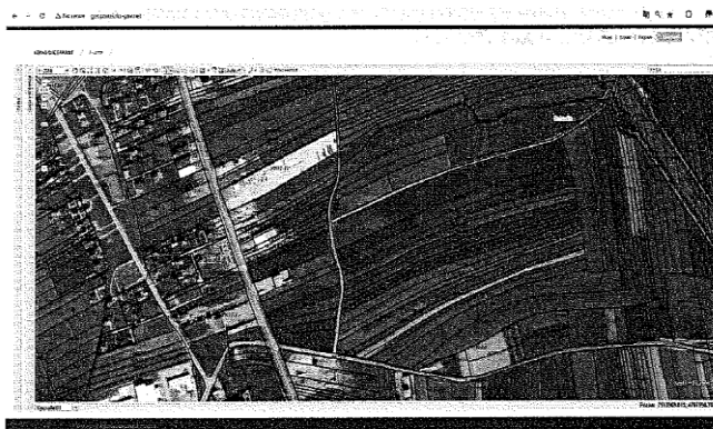
Fig.1 Ortofoto, parcela kadastrale nr. 989-0, ZK Banulle; http://eportal.rks.gov.net/

Nga raporti i te dhënave kadastrale (Certifikata nga SIKTK, shërbimet digjitale) prona evidentohet në emër të P.SH. E Kooperativës Bujqësore Lipjan me numër të njësisë P-71409003-00989-0 me sipërfaqe 3517m 2 (35ari e 17m 2 ) me kulture bujqësore Are e klasës 4-të.