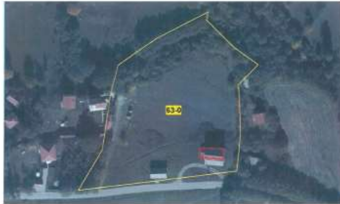
Ortofoto - Objekti (Mulliri) në z.k Brezchnik, Komuna e Pejë.

Objekti shtrihet në parcelën nr.63 z.k Brezchnik, parcelë kjo që figuron në emër të "PSH E Mirë e Fshatit".