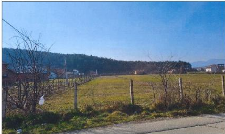
Pamje e parcelës nr.109-2 z.k Firzë, Komuna e Gjakovës

Fotografia e mëposhtme prezanton gjendjen faktike të parcelës nr.109-2 z.k Firzë, Komuna e Gjakovës: