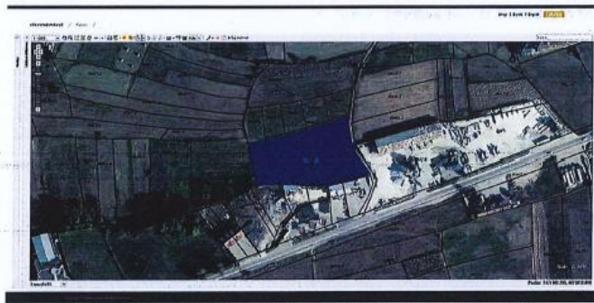
Fig.1 Ortofoto, parcelat kadastrale nr. 665-0 dhe 666-0, ZK Vlashnje; http://ecoportal.rks-gov.net/

Nga raporti i të dhënave kadastrale (Certifikata nga SIKTK, shërbimet digjitale) prona evidentohet në emër të Pasuri Shoqërore K.B.I PROGRES me numër të njësisë P-71813006-00665-0; sipërfaqe 2383m 2 ; kulture bujqësore Arë e klasës 2-të dhe P-71813006-00666-0; sipërfaqe 2800m 2 ; kulture bujqësore Livadh i klasës 2-të.