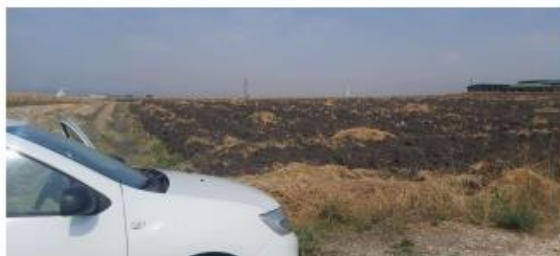
Fig. 2 Fotografi nga terreni

AGJENCIA KOSOVARE E PRIVATIZIMIT KOSOVSKA AGENCIJA ZA PRIVATIZACIJU PRIVATISATION AGENCY OF KOSOVO