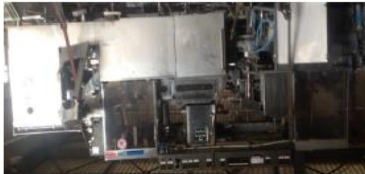
Makineria për mbushjen e lëngjeve