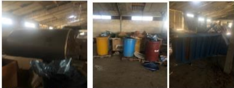
Pajisja Weygimoveket Epito