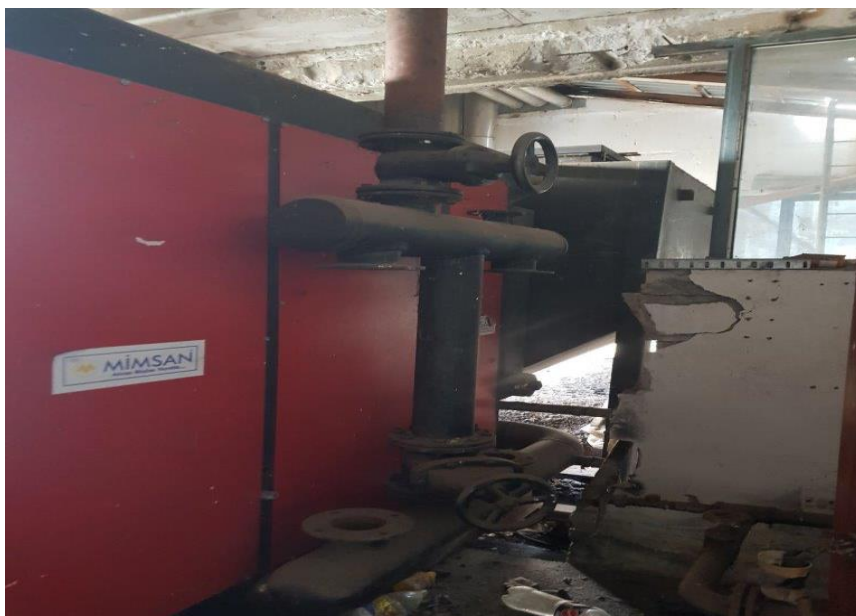
Kaldaja me thëngjill

Shënim: Këtu janë të paraqitura vetëm disa nga fotot e pajisjeve për shkak të vëllimit të dokumentit.