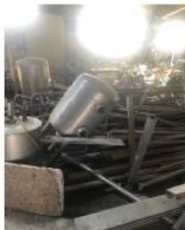
Tuba metalike, etj.