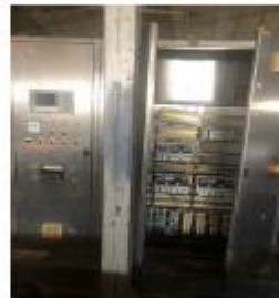
Paneli i rrymes (Nordson Saturn)