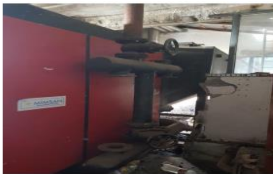
Kaldaja me thëngjill