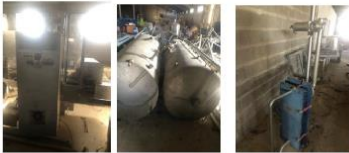
Pajisja Alfa Laval