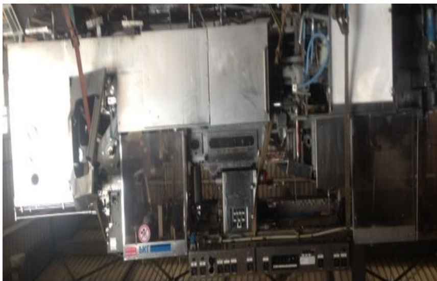
Makineria për mbushjen e lëngjeve

Foto/fotot Ose informata të tjera Për asetet në shitje