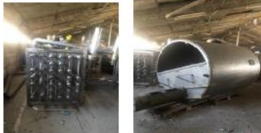
Pajisja Weygimoveket Epito