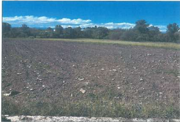
Pamje e parcelës nr.97-2 z.k Gjurqevik, Klinë

Fotografia e mëposhtme prezanton gjendjen faktike në terren :