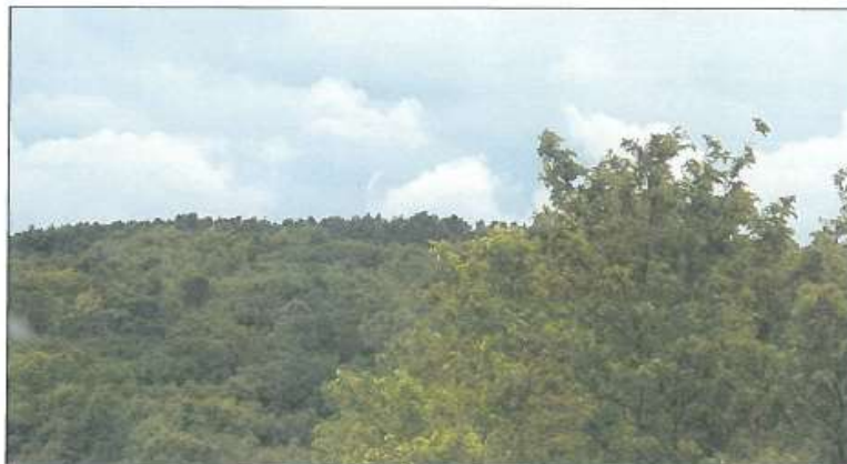
Pamje nga larg e parcelës nr.1-3 z.k Koshi, Komuna e Istogut.

Fotografia e mëposhtme e realizuar nga largësia prezanton gjendjen e parcelës në z.k Kosh: