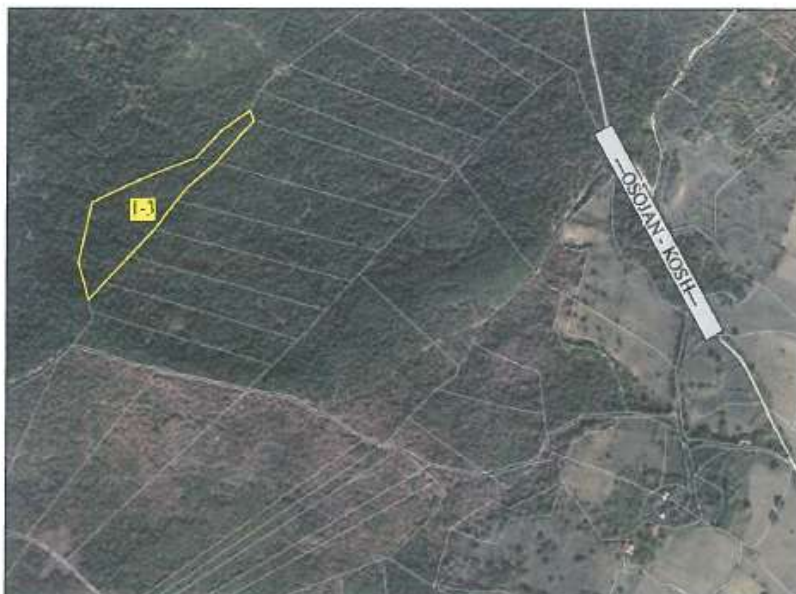
Ortofoto për parcelën nr.1-3 z.k Kosh, Komuna e Istogut.

Parcela sipas certifikatës së pronësisë evidentohet në emër të NPB Malishgan Sipërfaqja e përgjithshme e parcelës nr.1-3 z.k Kosh është 11314 m 2 (1 hektar, 13 ari dhe 14m 2 ), me kulturë: pyjor-mal i klasës 4.