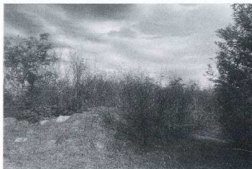
Fig. 2 Fotografi nga tereni

AGJENCIA KOSOVARE E PRIVATIZIMIT KOSOVSKA AGENCIJA ZA PRIVATIZACIJU PRIVATISATION AGENCY OF KOSOVO