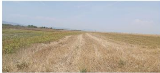
Fig. 2 Fotografi nga tereni

AGJENCIA KOSOVARE E PRIVATIZIMIT KOSOVSKA AGENCIJA ZA PRIVATIZACIJU PRIVATISATION AGENCY OF KOSOVO