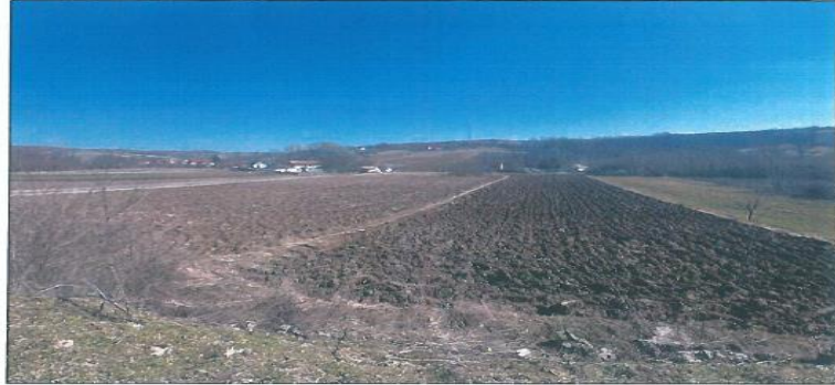
Pamje e parcelës nr.199-3 z.k Dranashiq, Klinë.

Fotografia e mëposhtme prezanton gjendjen e parcelës nr.199-3 z.k Dranashiq, Klinë: