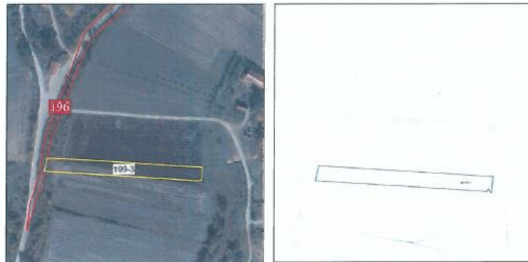
Ortofoto dhe kopja e planit për parcelën nr.199-3 z.k Dranashiq, Komuna e Klinës

Parcela sipas certifikatës së pronësisë evidentohet në emër të NPB Malishgan, me sipërfaqe prej 1566m 2 (15 ari dhe 66 m 2 ) me kulturë : bujqësore, arë e klasës 4.