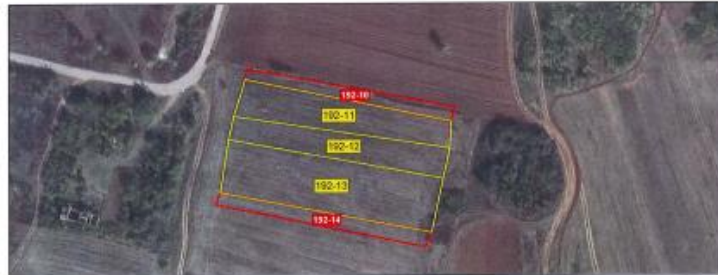
Ortofoto e parcelave nr. 192-11, 192-12 dhe 192-13 z.k Kërninë , Komuna e Istogut.

Sipërfaqja grafike e përbashkët e parcelave përpulhet me sipërfaqen tekstuale dhe është në kuadër të tolerancës.