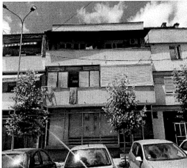
Foto e lokalit NSH.BANKKOS Rahovec.

Bashkangjitur gjeni foton, skicën dhe ortofoton e lokalit NSH.BANKKOS Rahovec: